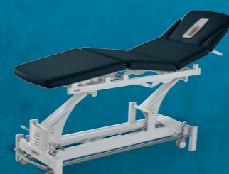
Quadroflex Luxe Anniversary