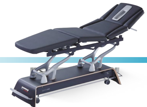
gymna.ONE Q8 Carbon Black