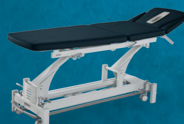
TrioFlex Luxe Anniversary