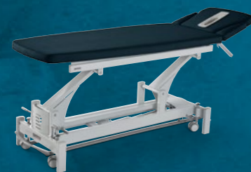
Duoflex Luxe Anniversary