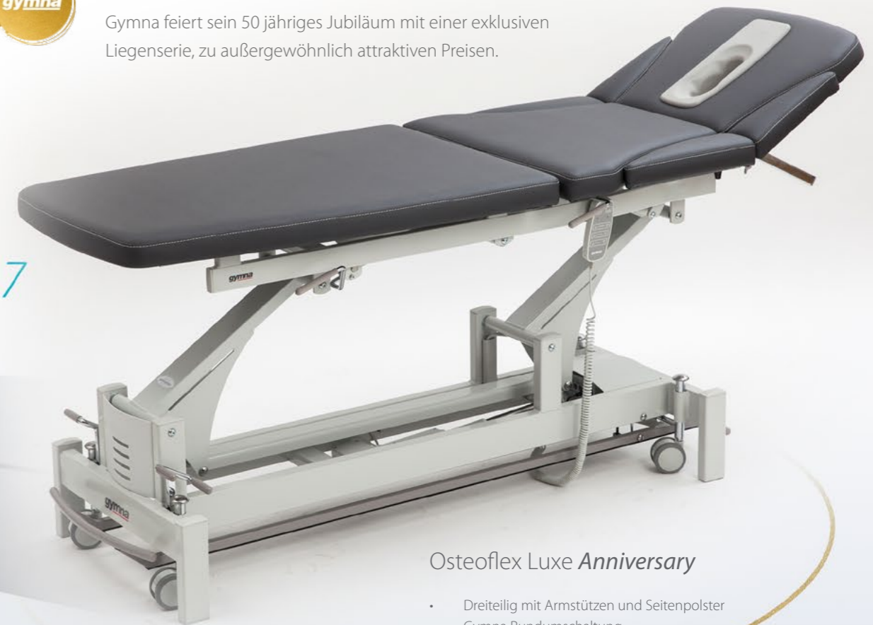
Osteoflex Luxe Anniversary

Gymna feiert sein 50 jähriges Jubiläum mit einer exklusiven Liegenserie, zu außergewöhnlich attraktiven Preisen.